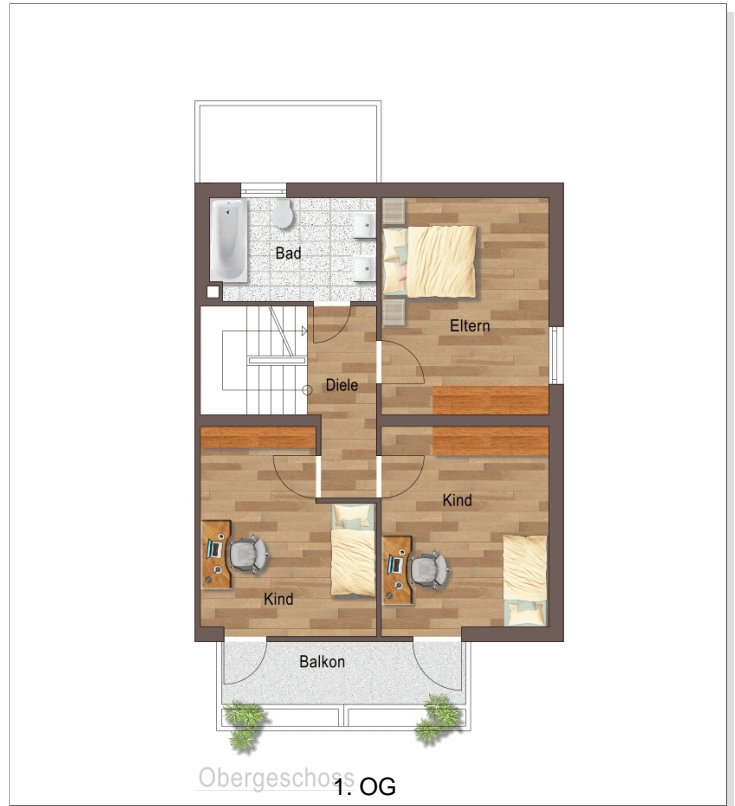
Obergeschoss 1. OG