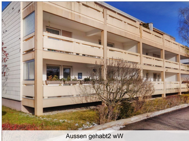
Aussen gehabt2 wW