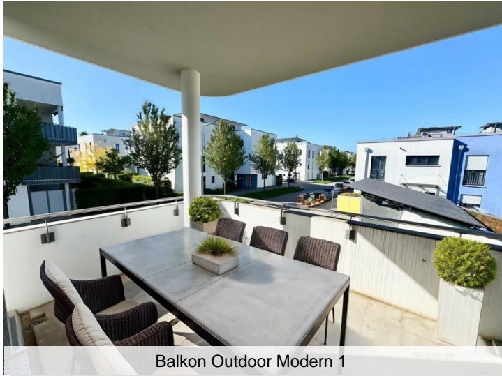
Balkon Outdoor Modern 1