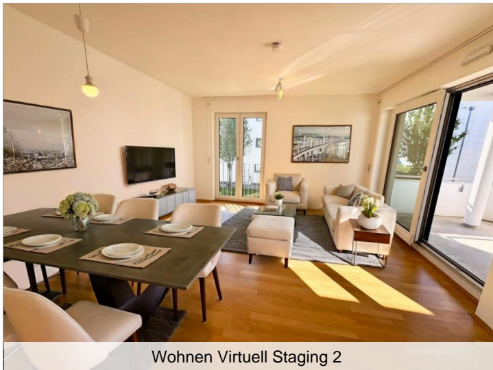
Wohnen Virtuell Staging 2