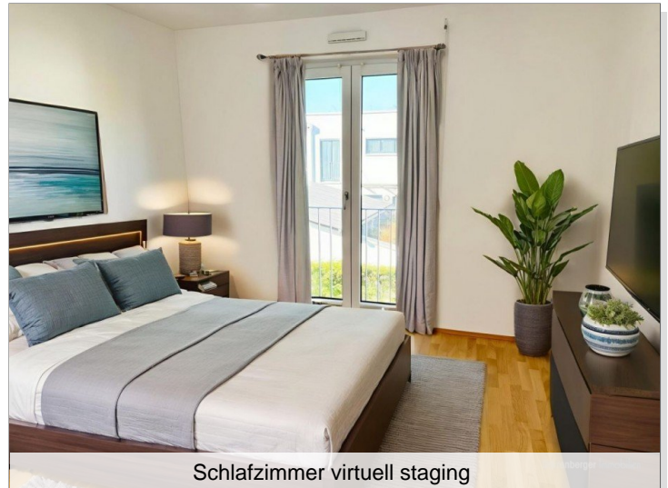
Schlafzimmer virtuell staging