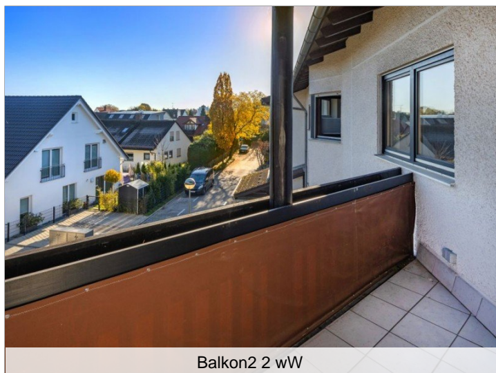
Balkon2 2 wW